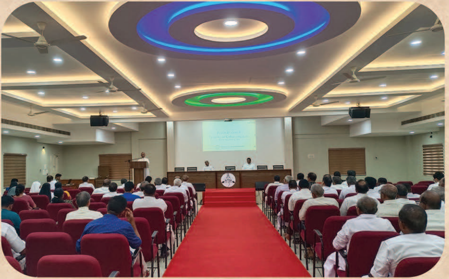
വാസ്റ്ററൽ കൗൺസിൽ 2023, ഡിസംബർ 16