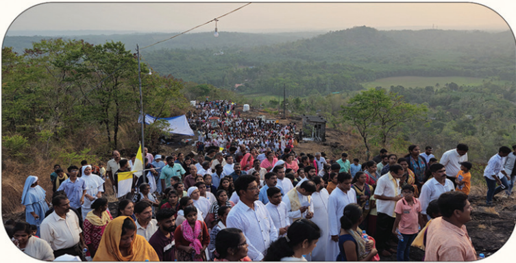
2024 മാർച്ച് 17ന് രൂപതാഭിമുഖ്യത്തിൽ നടന്ന നാടുകാണി കുരിശുമല തീർത്ഥാടനം