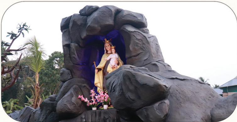
2024 മാർച്ച് 21ന് അഭിവന്ദ്യ പിതാവ് വെഞ്ചുരിച്ച കോട്ടപ്പടി സെന്റ് സെബാസ്റ്റ്യൻസ് പള്ളിയുടെ ശ്രോദ്ദോ