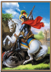
24 വി. ഗീവർഗീസ്