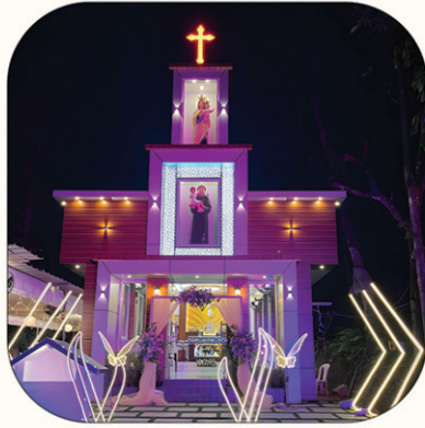
2024 മാർച്ച് 16ന് അഭിവന്ദ്യ പിതാവ് വെഞ്ചുരിച്ച പാറപ്പുഴ സെന്റ് ആന്റണീസ് ക്ഷേത്രം