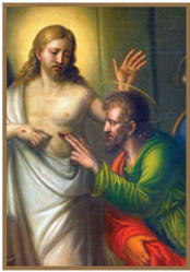
7 പുതുഞായർ, ദൈവകരുണയുടെ തിരുനാൾ