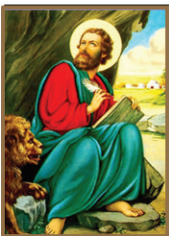
25 വി. മർക്കോസ്