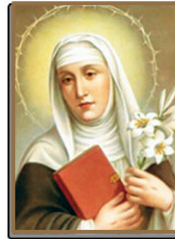
29 സിയനായിലെ വി. കാതറിൻ