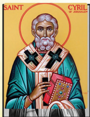
18 ജനുസലെമിലെ വി. സിറിൽ