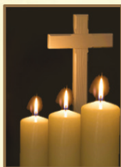
30 വലിയ ശനി