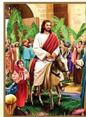
24 ഓശാന ഞായർ