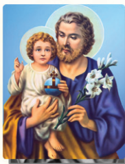
19 വി. യൗസേപ്പിതാവ്