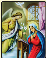
25 മംഗളവാർത്ത തിരുനാൾ