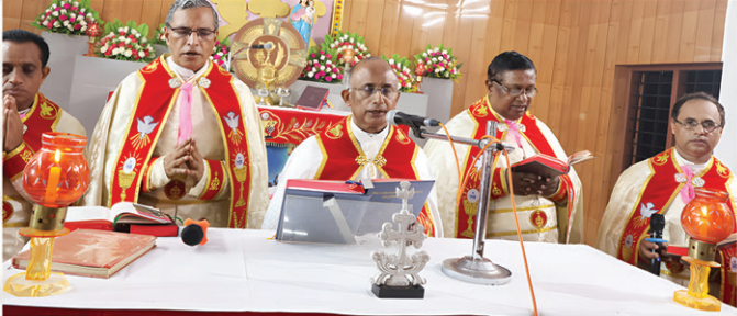
2024 ഫെബ്രുവരി 16നു രൂപതാഭിമുഖ്യത്തിൽ നടന്ന ആരക്കുഴ മലേക്കുരിൽ തീർത്ഥാടനം